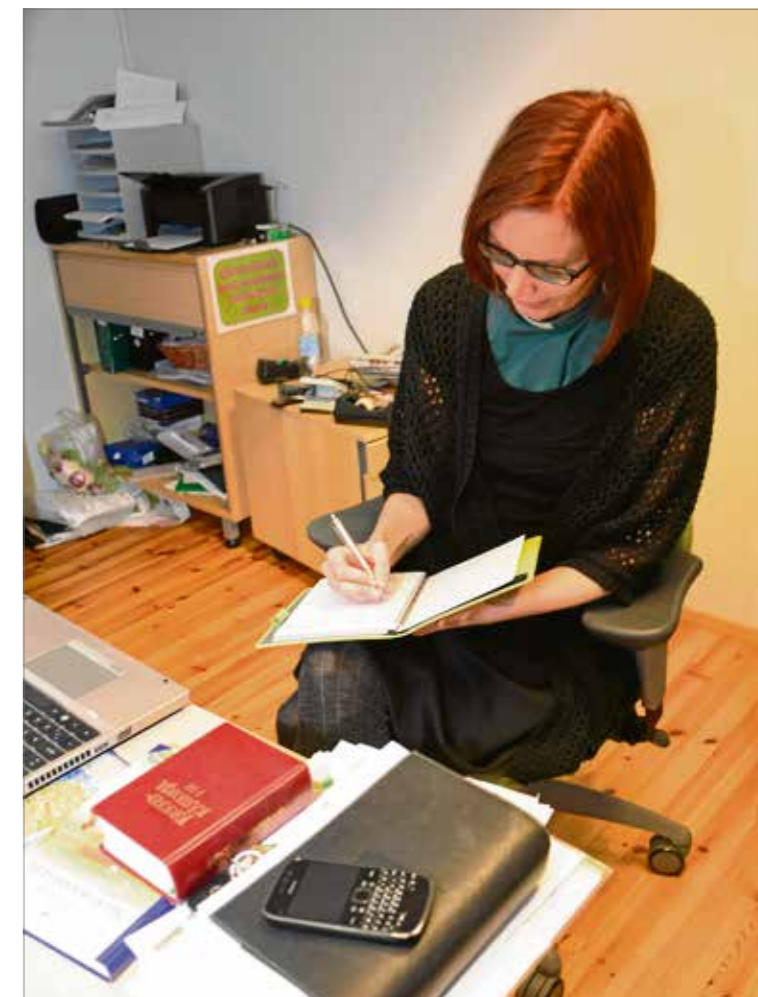
Oman alueen diakoniatyöntekijälle voi varata ajan tiistaisin klo 9–10 puhelimitse.

Monesti kuulee ilahtuneesti sanottavan seurakunnan työntekijästä, erityisesti papista: ”Sehän onkin ihan tavallinen ihminen!” Varsin tavallisia ja vajavaisia, omanlaisia ja monenlaisia osaamisia omaavia olemmekin koko joukko, niin kuin muuallakin työelämässä. Seurakunnan työnteki-